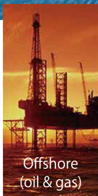
Offshore (oil & gas)